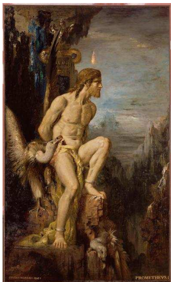
Gustave Moreau, Prométhée

Au centre de l'atelier sont présentées des esquisses pour les neuf tableaux exposés par Gustave Moreau au Salon entre 1852 et 1872, commentés par Théophile Gautier. Sur les cimaises face à la verrière, se trouve Hercule et les filles de Thespius (huile sur toile, Cat. 25) que Théophile Gautier vit dans l'atelier de Gustave Moreau.