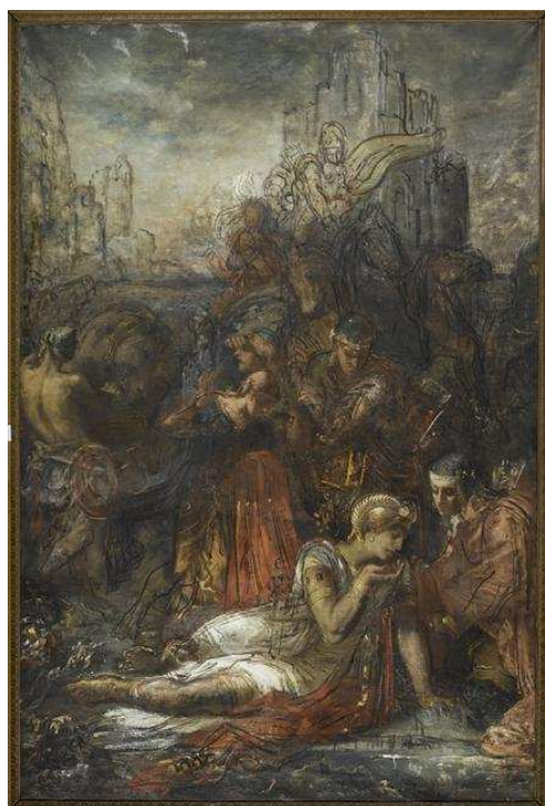
Gustave Moreau, Darius

À l'occasion du bicentenaire de la naissance de Théophile Gautier (1811-1872), le musée Gustave Moreau propose un parcours dans ses collections, permettant de découvrir les œuvres du peintre Gustave Moreau (1826-1898) à la lumière des textes de l'écrivain. Critique d'art influent durant la seconde moitié du 19 e siècle, Théophile Gautier a en effet commenté, de 1852 jusqu'à sa mort, les tableaux exposés par Gustave Moreau au Salon, exposition annuelle des artistes vivants. Ces œuvres ont pour la plupart été vendues par le peintre et se trouvent aujourd'hui dans des musées du monde entier. Le musée Gustave Moreau conserve néanmoins trois de ces œuvres, ainsi que de nombreuses esquisses pour ces tableaux.