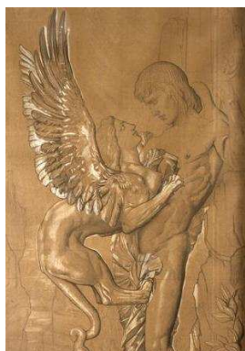
Gustave Moreau, Œdipe et le Sphinx