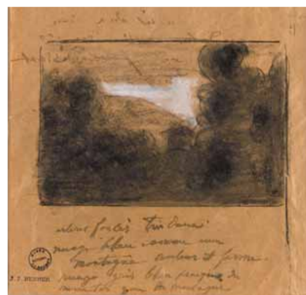
JEAN-JACQUES HENNER, Paysage d'Alsace , vers 1902

Peindre d'après nature est une des recommandations que tout artiste du XIX e siècle reçoit de ses maîtres. En effet, depuis Pierre-Henri de Valenciennes (1750-1819), célèbre paysagiste néoclassique, les études à l'huile réalisées en plein air constituent un des piliers de l'enseignement académique au même titre que l'exercice classique de copie des maîtres anciens. L'ouvrage qu'il a publié en 1800 Éléments de perspective pratique à l'usage des artistes, suivis de réflexions et de conseils sur la peinture et particulièrement sur le genre de paysage reste, au temps de Henner, une référence majeure.