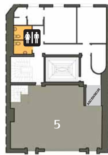
3 e étage > ASCENSEUR NIV. 4