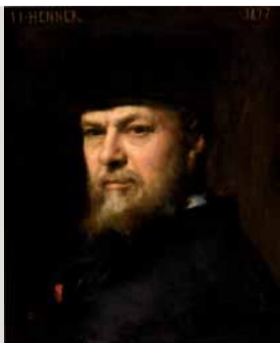
JEAN-JACQUES HENNER, Autoportrait , vers 1877