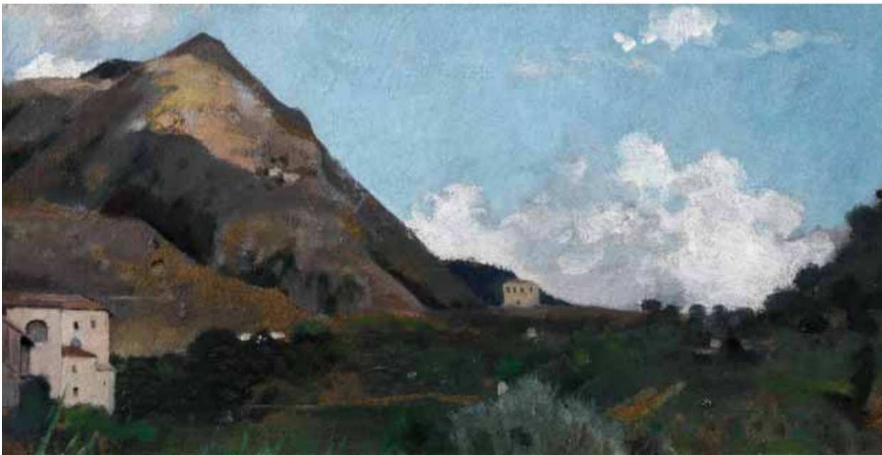
JEAN-JACQUES HENNER, Montagne des environs de Rome , vers 1859

« Ici à Rome, on dirait que la nature s'est plu à réunir tout ce qui peut réjouir un artiste : la campagne, les montagnes, la végétation, le ciel, les habitants, les costumes, en un mot tout » (LETTRE À GRÉGOIRE HENNER, 1862).