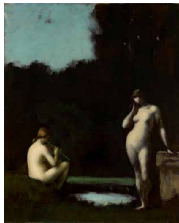
JEAN-JACQUES HENNER, Idylle dite Mélodie du soir , vers 1872

« On se doute guère, dans le public, qu'Henner cherche si longuement et scrupuleusement ses fonds de tableaux. On croit volontiers qu'il reproduit le même paysage. En fait, la composition de chacun de ses tableaux lui coûte de grands efforts et ses nombreuses esquisses ont toujours pour objet quelque modification rêvée... ». (ÉMILE DURAND-GRÉVILLE, 1881)