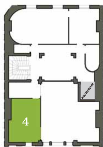
2 e étage > ASCENSEUR NIV. 3