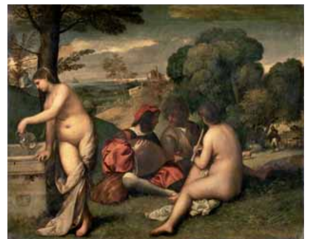
TITIEN, Le Concert champêtre , vers 1509, Paris, musée du Louvre

Il peuple ce paysage imaginaire de nus féminins, nymphes ou naïades qui empruntent des poses inspirées par Titien. En effet, l'harmonie paisible du paysage et la beauté des personnages qui caractérisent Le concert champêtre et Amour sacré, Amour profane ont influencé Henner de manière définitive. Intitulés Idylle ou Églogue , ces tableaux sont empreints d'une poésie qui a marqué les visiteurs des Salons comme Sarah Bernhardt :