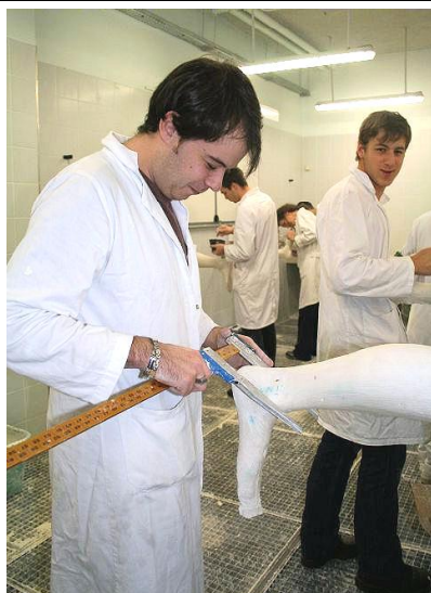
Rectification d'un positif plâtré

La formation comprend 8 semaines de stage en milieu professionnel.