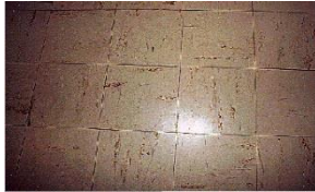
Dalles de sol