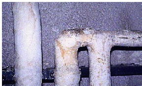
Calorifugeage de tuyaux